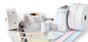
食券/チケット用紙/お買物券等