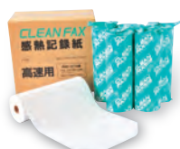
ファクシミリ用紙