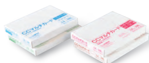
CCマルチカード(名刺用紙)