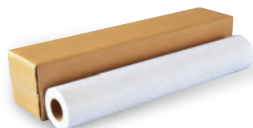
大判インクジェットプリンタ用紙