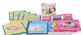
各種インクジェット用紙