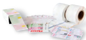
物流伝票/物流ラベル