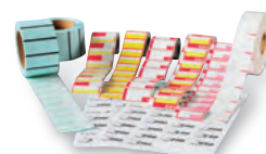
食品POS/値引きラベル