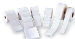
工業用/医療用ラベル