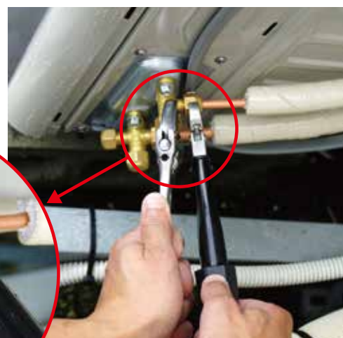
フレアナット締め付けトルク(参考)