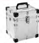
(ショルダーベルト付き)