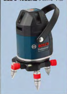
GLL 5-40ELR型 (パルスモード付)