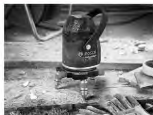
現場作業に耐える高い防塵・防水性能のIP54。