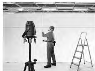
見やすい高輝度ラインで、作業効率が向上。

*アルミ三脚は、GLL 5-40ESET型とGLL 8-40ESET型には標準付属です。