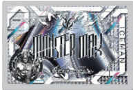
モンスターマックス 保冷剤