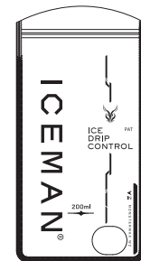
保冷剤 収納ポケット