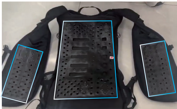
セルマックス（水路シート）取付位置