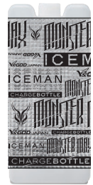
モンスターマックス 5.0 （チャージボトル）