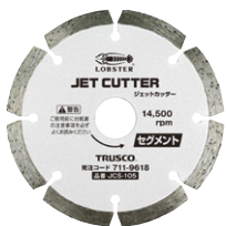
セグメントタイプ JCS-105