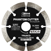
セグメントタイプ PCS-105