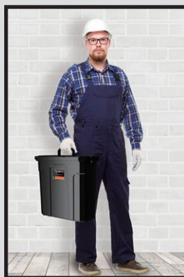
収納時: W450×H409×D214 (mm)