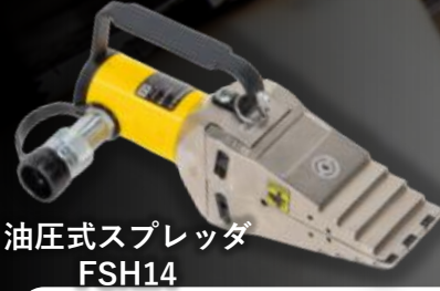
油圧式スプレッダ FSH14