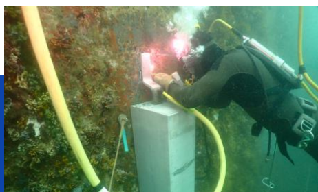
水中溶接作業の様子