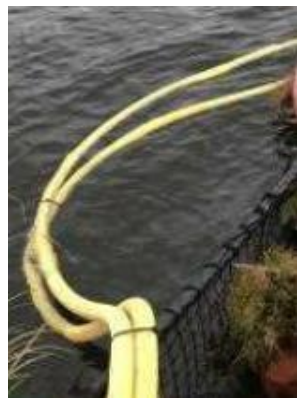
フロートケーブル