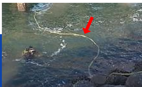
潜水土用の操作線ケーブル