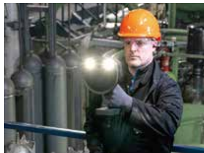
暗所の作業に強い作業用LED