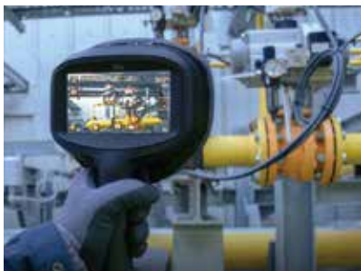
鮮明な画像で検査時間短縮